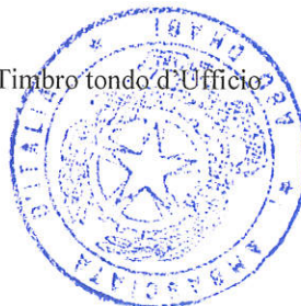
Timbro tondo d'Ufficio